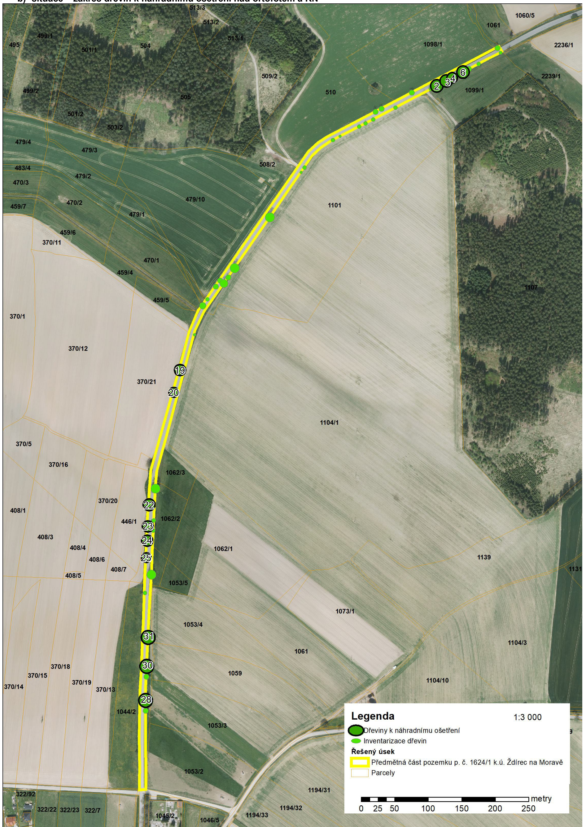
situace ve zmenšeném měřítku