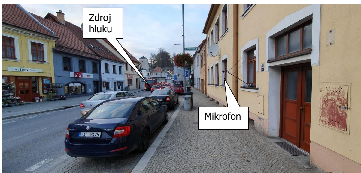
Obr.3: Fotografie měřicího místa, Novosady 1124/31, 594 01 Velké Meziříčí, okres Žďár nad Sázavou, Kraj Vysočina, Česko