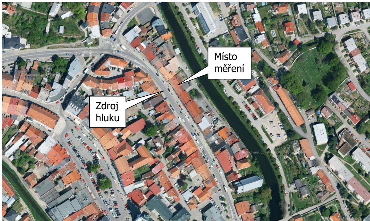
Obr. 1: Situační fotografie zdroje hluku a měřícího místa- výstřižek z mapy: Novosady 1124/31, 594 01 Velké Meziříčí, okres Žďár nad Sázavou, Kraj Vysočina, Česko

Teplota vzduchu: 6 až 13 °C Atmosférický tlak: 1013 - 1025 hPa Relativní vlhkost: 56 - 76 % Rychlost větru: < 3 m/s