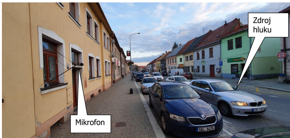
Obr.2: Fotografie měřicího místa, Novosady 1124/31, 594 01 Velké Meziříčí, okres Žďár nad Sázavou, Kraj Vysočina, Česko