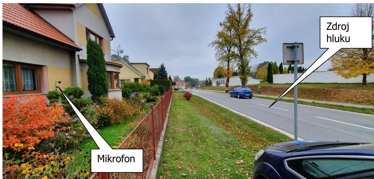
Obr.2: Fotografie měřicího místa, Rynárec 94, 394 01 Rynárec, okres Pelhřimov, Kraj Vysočina, Česko