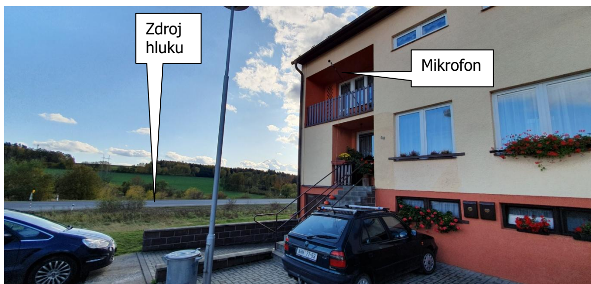
Obr.3: Fotografie měřicího místa, Strměchy 49, 393 01 Pelhřimov - Strměchy, okres Pelhřimov, Kraj Vysočina, Česko