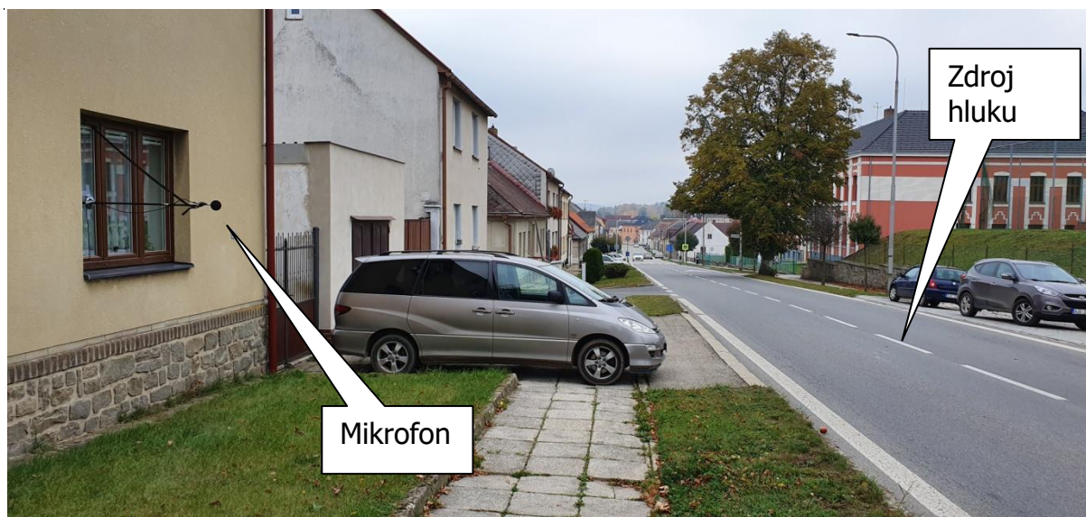
Obr.2: Fotografie měřicího místa, Tyršova 318, 394 03 Horní Cerekev