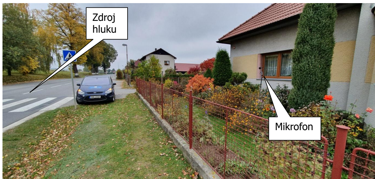
Obr.3: Fotografie měřicího místa, Rynárec 94, 394 01 Rynárec, okres Pelhřimov, Kraj Vysočina, Česko