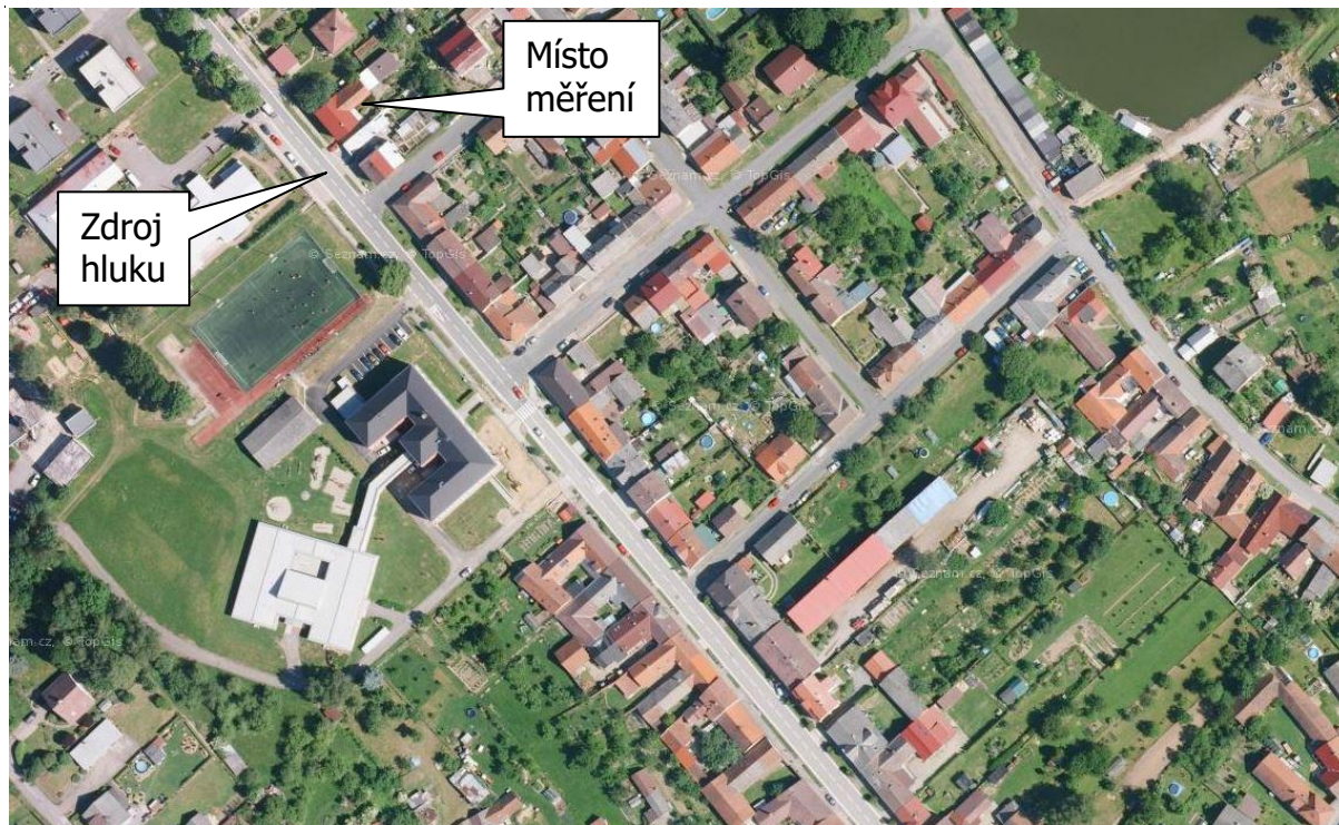
Obr.1: Situační fotografie zdroje hluku a měřícího místa- výstřižek z mapy: Tyršova 318, 394 03 Horní Cerekev

Teplota vzduchu: 11 - 16 °C Atmosférický tlak: 1012 - 1021 hPa Relativní vlhkost: 73 - 89 % Rychlost větru: < 1 m/s