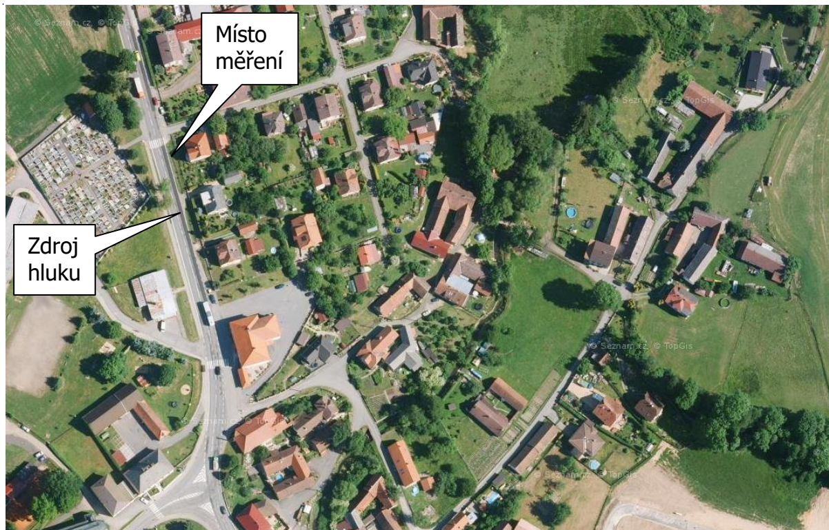
Obr.1: Situační fotografie zdroje hluku a měřicího místa- výstřižek z mapy: Rynárec 94, 394 01 Rynárec, okres Pelhřimov, Kraj Vysočina, Česko

Teplota vzduchu: 11 - 16 °C Atmosférický tlak: 1012 - 1021 hPa Relativní vlhkost: 73 - 89 % Rychlost větru: < 1 m/s