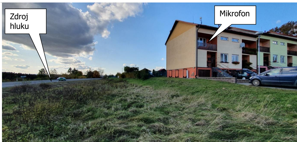
Obr.2: Fotografie měřicího místa, Strměchy 49, 393 01 Pelhřimov - Strměchy, okres Pelhřimov, Kraj Vysočina, Česko