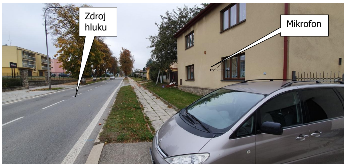
Obr.3: Fotografie měřicího místa, Tyršova 318, 394 03 Horní Cerekev