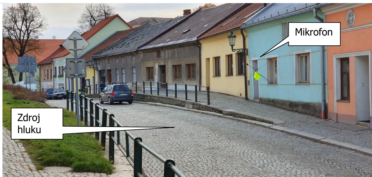
Obr.2: Fotografie měřicího místa, Legionářská 217, 588 32 Brtnice, okres Jihlava, Kraj Vysočina, Česko