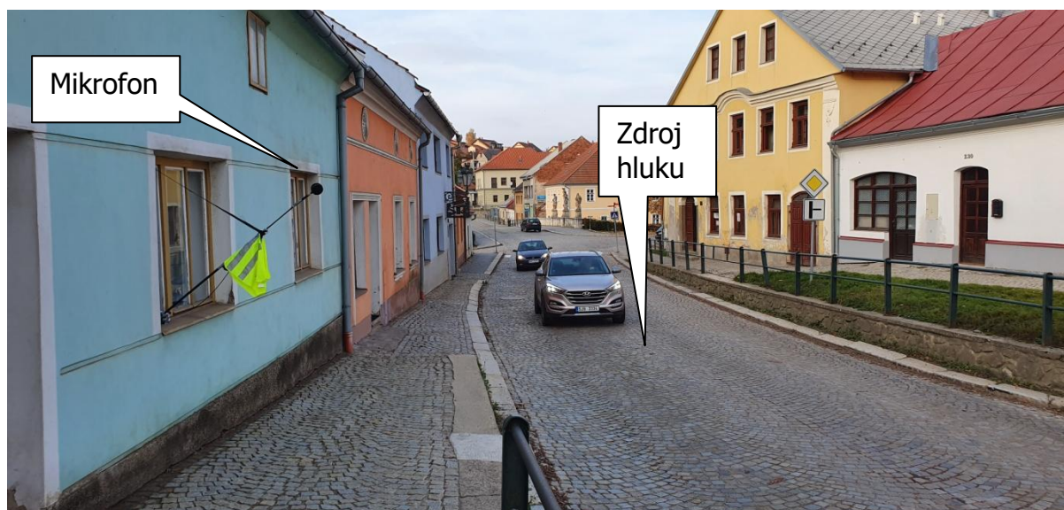
Obr.3: Fotografie měřicího místa, Legionářská 217, 588 32 Brtnice, okres Jihlava, Kraj Vysočina, Česko